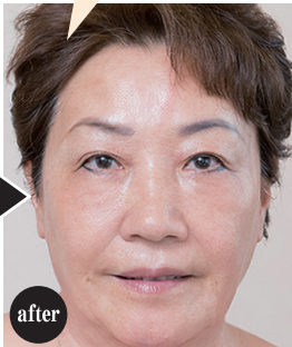
【施術事例】《コース開始時》 ※写真はコース終了後の結果です